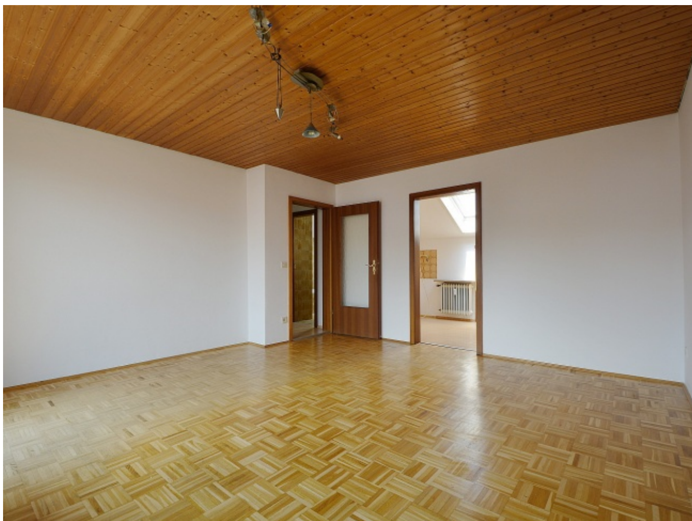
wohnen u. essen