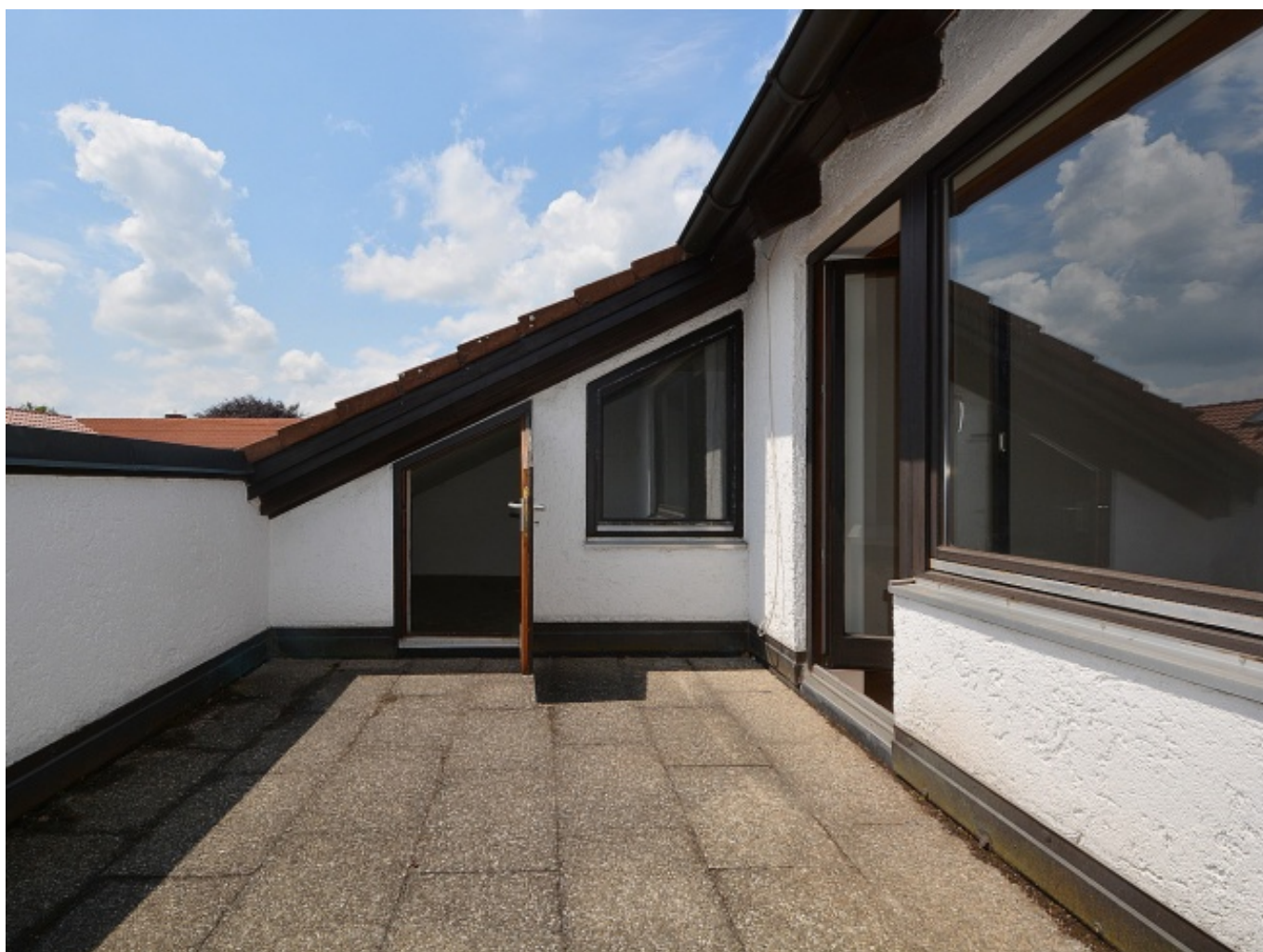
Dachterrasse u. Abstellraum