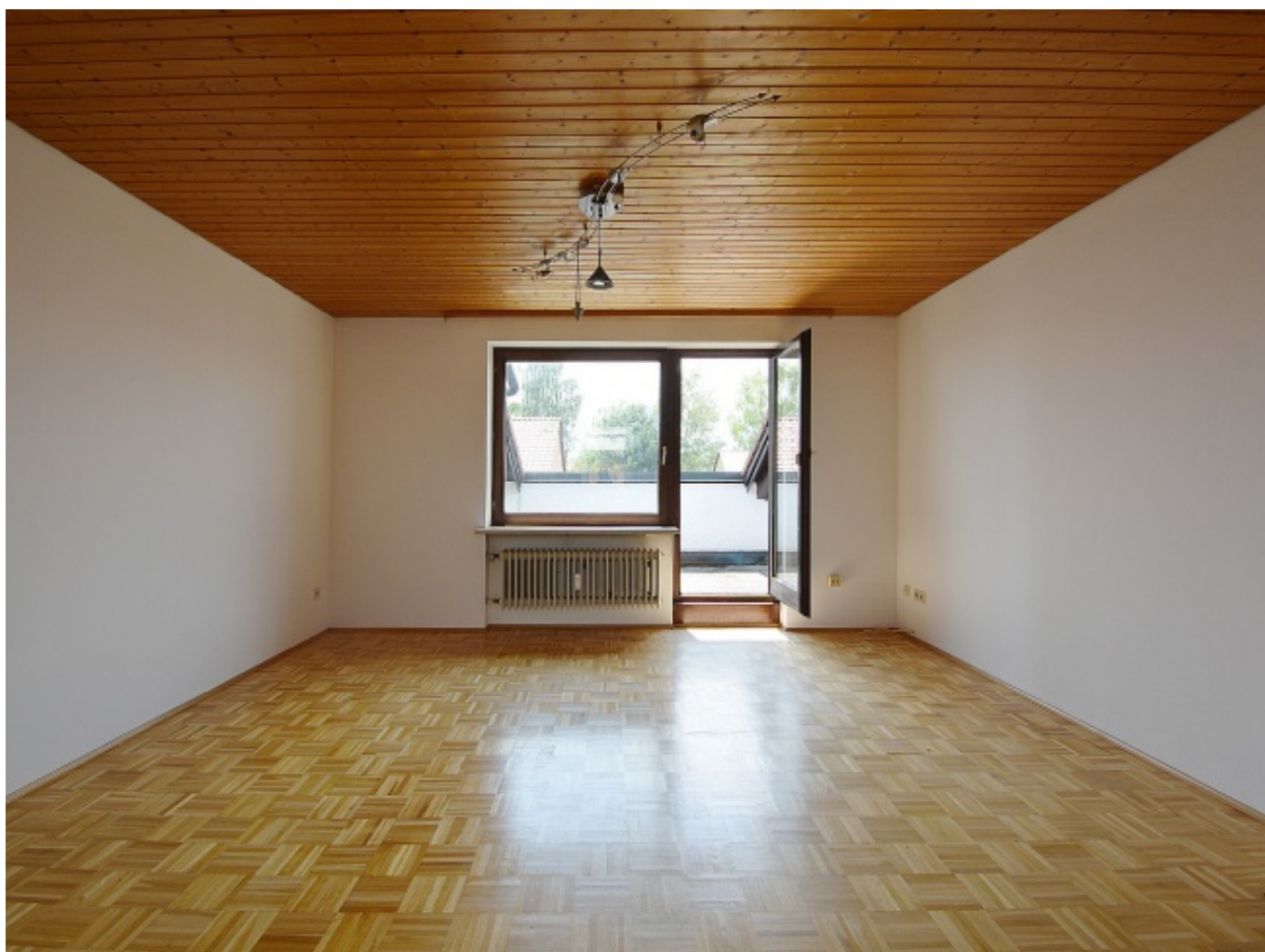
essen u. wohnen